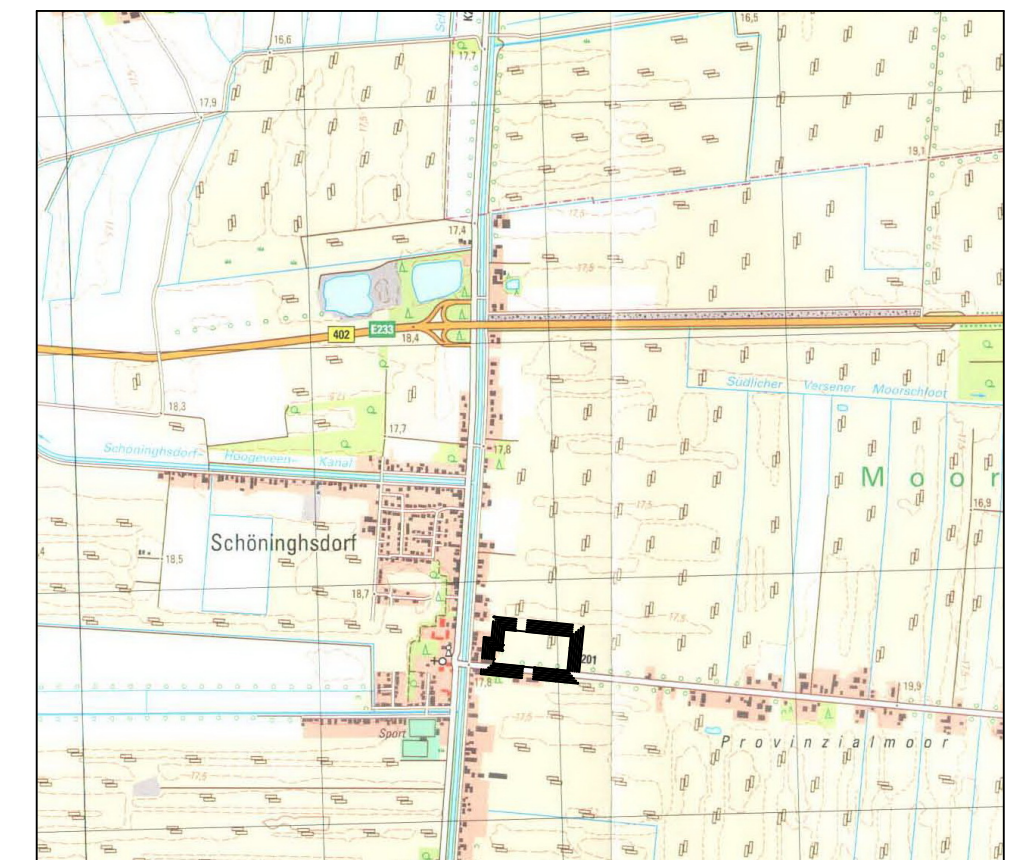
Übersichtsplan M 1:25000